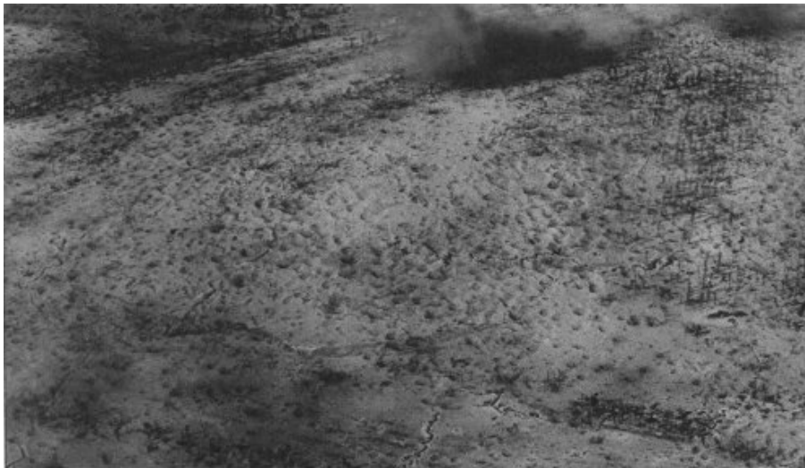
les pentes sud ouest du mont Cornillet et le grand boyau du col vue oblique prise en avion à 600 m ètres, le 2 mai (section photographique de l'Armée