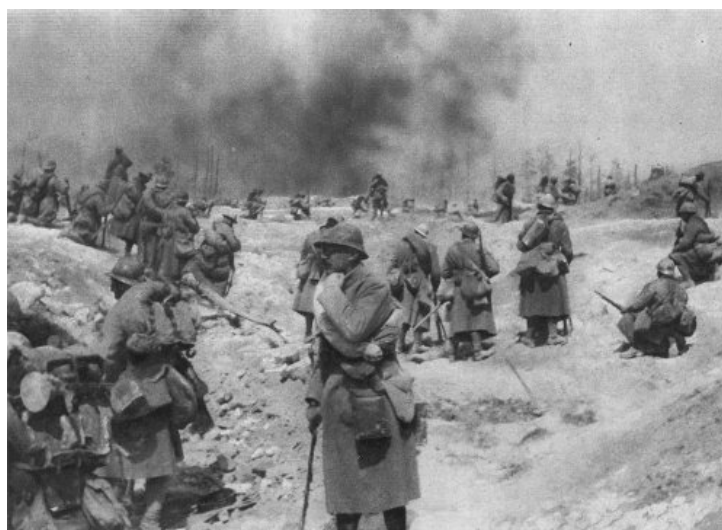
un bataillon de la division Brulard abordant la ligne de cette crête qui va être progressivement conquise dans la journée

Le 19, tandis que nous reprenons notre préparation d'artillerie sur le réduit du bois de la Grille, une très violente attaque allemande se produit sur notre aile gauche, menée par un régiment fraîchement débarqué, le 145e prussien. Nos hommes, bien que fatigués par deux jours et deux nuits de combats ininterrompus, tiennent tête à l'ennemi et le repoussent soit par le feu, soit par une charge à la baïonnette. Nouvelle tentative allemande le 20 sur la lisière Ouest du bois de la Grille, pareillement repoussée. L'action qui doit nous assurer en totalité la possession du bois de la Grille est ajournée en raison des destructions incomplètes du fortin. Le bois rend les observations difficiles.