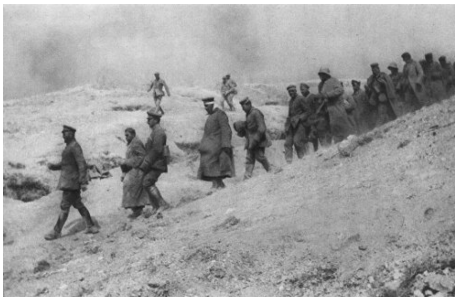
prisonniers descendant les pentes du mont Perthois Entre le Mont Haut et le casque : l'attaque du 30 avril