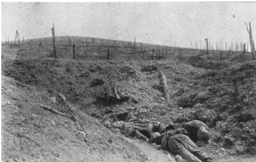
Le mont Cornillet vu des tranchées de départ du 83e d'Infanterie, dont il était l'objectif, le 16 avril