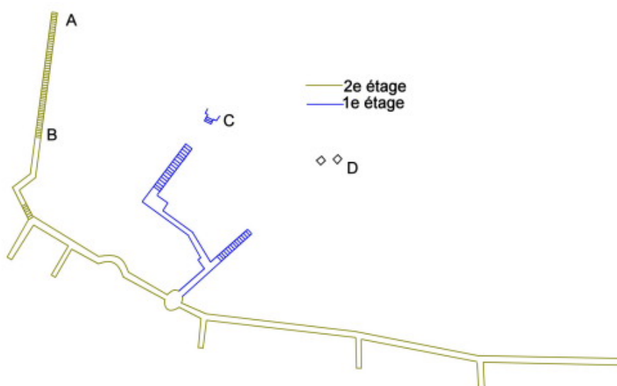
Plan du tunnel de Weimar.

La sortie marquée en C. paraît être celle de l'escalier correspondant, débouchant du 1er étage. Une niche à périscope installée en D près d'une sortie semble avoir un certain rapport avec le travail. »