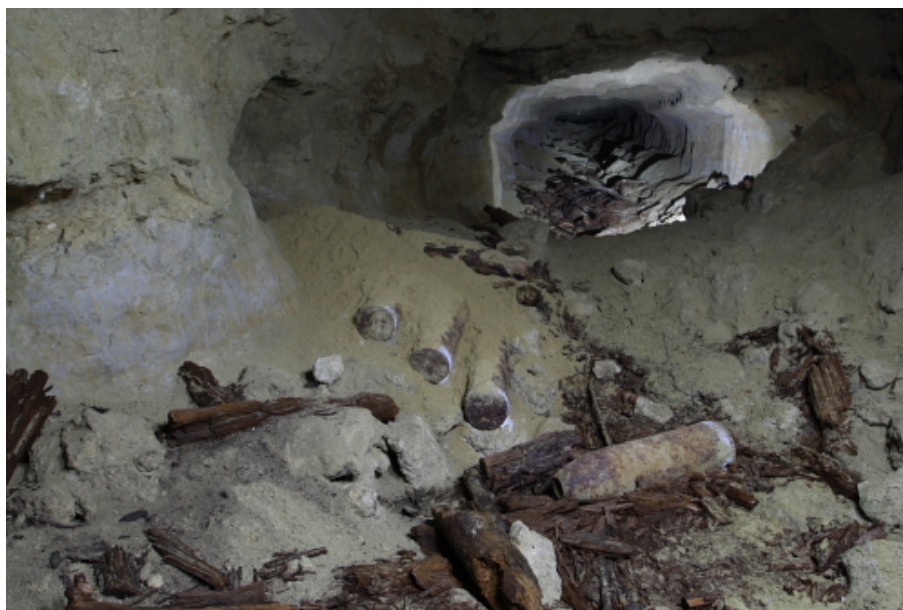
Exemple de tunnel au chemin des dames.

Au cours des offensives tentées dans ce secteur les 16 avril et 5 mai, ces abris ont joué un rôle considérable, sauf dans le cas où les ouvrages sont connus, en particulier les entrées. Par exemple, les réserves abritées dans le tunnel est de Cerny dont l'artillerie a pu battre l'entrée et que, par suite, l'infanterie française a pu occuper rapidement, ont été dans l'impossibilité de se défendre et ont dû se rendre. Par contre, les autres ont opposé et opposent encore une vigoureuse résistance.